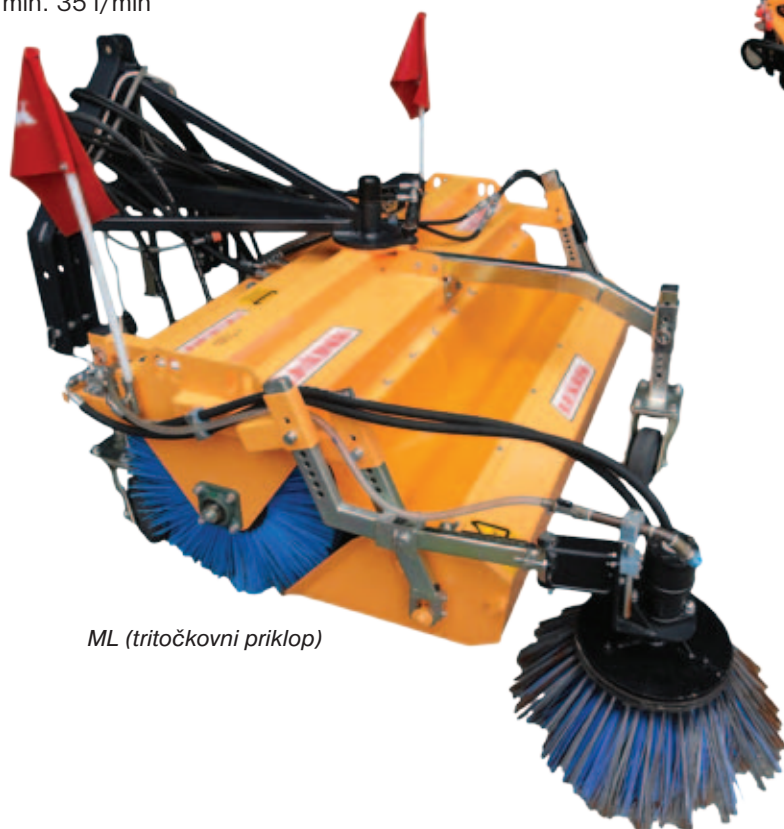
ML (tritočkovni priklop)