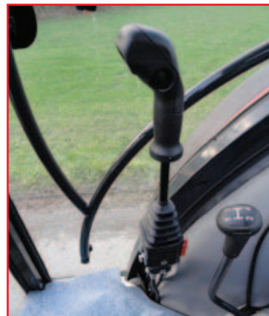
enoročni krmilni ventil (JOYSTICK)