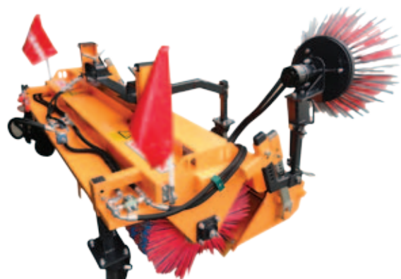
ML V (viličarski priklop)